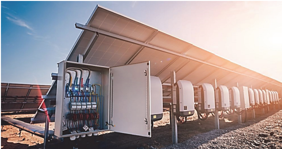
Фиг. 4. Системи за съхранение на соларна енергия

Електрическото съхранение е най-желателно, тъй като е потенциално най-ефективно. Импулсните захранвания са с висока ефективност, така че енергията, идваща под формата на електричество се използва при зареждане на акумулаторни батерии или супер кондензатори. С импулсните преобразуватели може да се реализира трансфер на големи мощности.