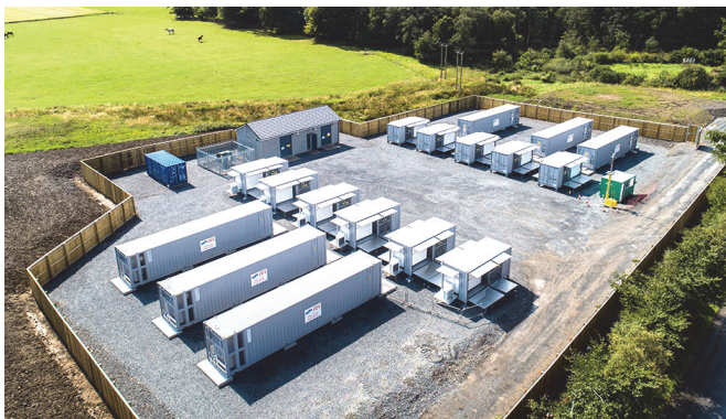
Фиг. 1. Масив от батерии и преобразуватели

Необходимо е да има локални и разпределени системи за съхранение на енергия (ESS). Масивите за батерии използват за основен компонент най-вече литиеви батерии. Формирането на инфраструктурата на такива масиви, дава възможност за управляване на разпределено генериране, пренос, съхранение и доставка до крайните клиенти - потребители.