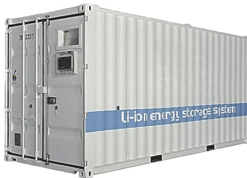
Фиг. 5. Батерийни модули (масиви) за съхранение на соларна енергия

Водещо направление в съхранение на енергията е батерийната технология.