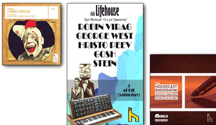
Фиг. 2. Марка на компанията Housecast Records

Основните клаузи в договора между лейбъла и артиста са: