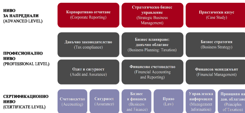
Фиг. 1. Структура на модулите, включени в квалификацията „дипломиран експерт-счетоводител“ на ICAEW

УНСС имат успешно сътрудничество с ICAEW, като към края на 2015 г. професионалната организация признава шестте модула от първо сертификационно ниво за квалификацията „дипломиран експерт-счетоводител“ (ICAEW ACA qualification): „Сигурност“ („Assurance“), „Управленска информация“ („Management information“), „Право“ („Law“), „Бизнес и финанси“ („Business and Finance“), „Принципи на данъчно облагане“ („Principles of taxation“) и „Счетоводство“ („Accounting“) [5]. Това на практика означава, че завършилите бакалаври по счетоводство, финанси или финансов контрол, след полагане на изпити по определени задължителни и избираеми дисциплини, включени в учебните планове, могат да продължат на право с изпитите от второ професионално ниво от квалификацията на ICAEW (вж. фиг. 1). Това е голям успех и признание за качеството на българското счетоводно образование, което отговаря на световните изисквания и е конкурентно-способно. Считаме, че това е правилната посока за развитие, тъй като международната практика показва, че водещи университети във Великобритания, САЩ, Франция и др. отдавна са изградили и профитират от такова колабориране.