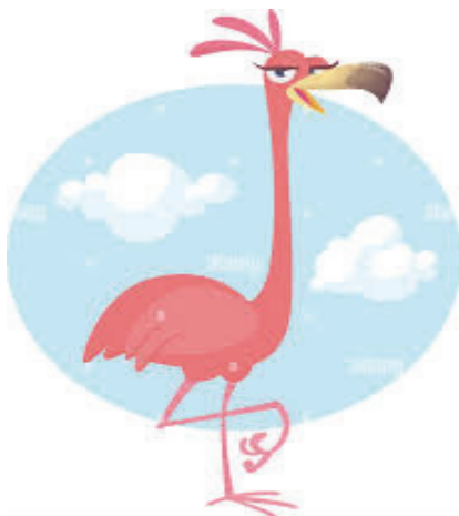
Фиг. 1. Изображение на Фламинго

Цел на заданието: изследване на собствения образ и начина на възприемане на другия, изграждане на позитивен „Аз“ образ;