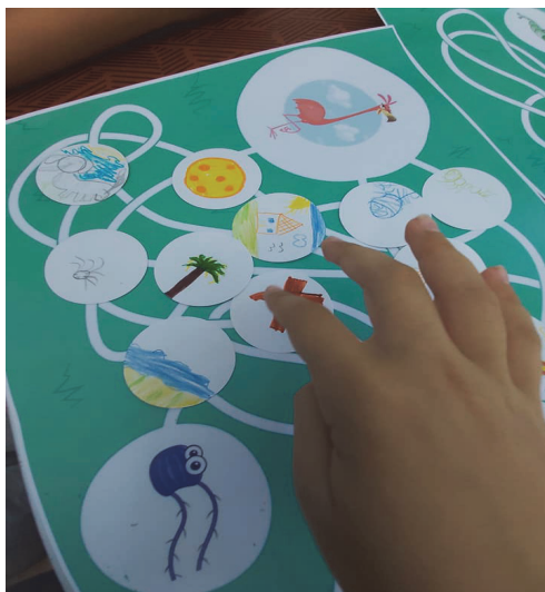
Фиг. 4. Изображение от практическа тренингова ситуация с играта „Лабиринтът на Фламинго“