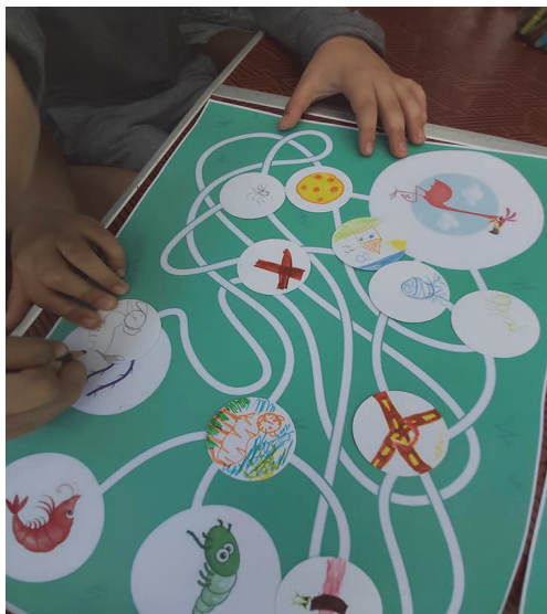
Фиг. 5. Изображение от практическа тренингова ситуация с играта „Лабиринтът на Фламинго“