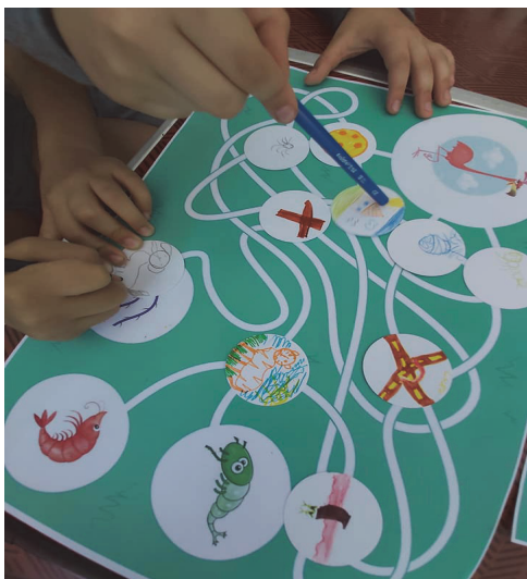
Фиг. 3. Изображение от практическа тренингова ситуация с играта „Лабиринтът на Фламинго“