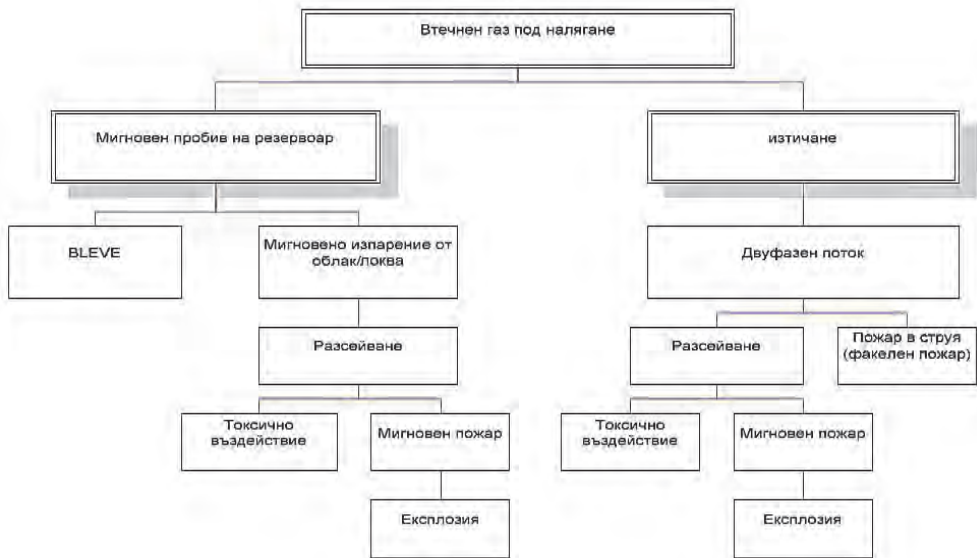
Фиг. 2. Дърво на събитията при изтичане на втечен газ под налягане

Вторият пример, показан на фиг. 2, се отнася до изтичането на течност. Този пример показва отново разликата между незабавното и забавеното възпламеняване. В този случай обаче, остатъкът от течността, останал след мигновения пожар/експлозията ще бъде обхванат от пожар в локва. Забележете различната роля на дисперсията в дървото на събитията, представено на фиг. 2.