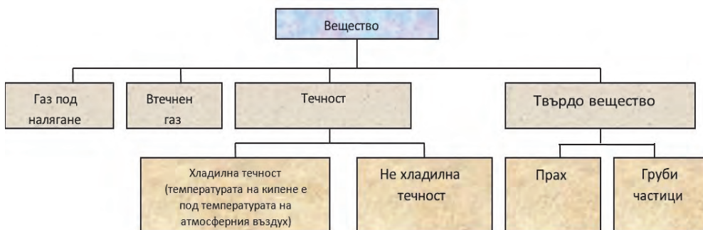
Фиг. 1. Агрегатно състояние на веществата

Последствията могат да бъдат класифицирани в съответствие с различни критерии, например, в съответствие с физичното състояние на веществата или в съответствие с вида на резервоара. При анализа на последствията трябва да се има предвид следната схема по отношение на физичното състояние: