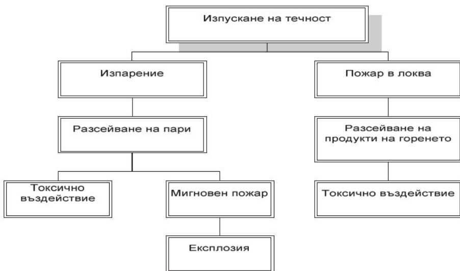
Фиг. 3. Дърво на събитията при изтичането на течност

Вторият пример, показан на фиг. 2, се отнася до изтичането на течност. Този пример показва отново разликата между незабавното и забавеното възпламеняване. В този случай обаче, остатъкът от течността, останал след мигновения пожар/експлозията ще бъде обхванат от пожар в локва. Забележете различната роля на дисперсията в дървото на събитията, представено на фиг. 2.