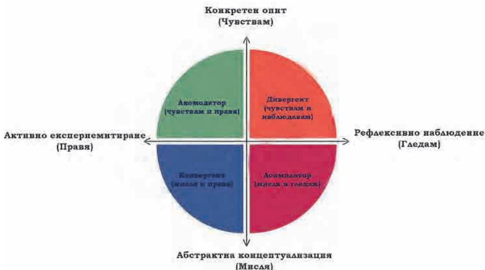
Фигура 1. Модел на Д. Колб за стилове на учене чрез преживяване

Теорията на Колб определя ученето чрез преживяване като процес от четири етапа: