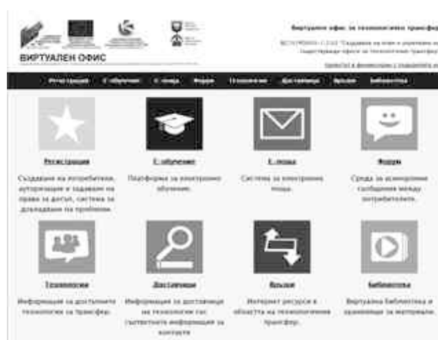
Фиг.2. Рецепция на ВОТТ.

Основна цел на виртуалния офис за технологичен трансфер е да подпомага и поддържа членовете на офиса, клиентите му и всички негови потенциални потребители, осигурявайки за целта необходимия набор от услуги и функционалности. Виртуалният офис е изграден от интегрирани в общо пространство архитектурни модули, първият от които е модулът „Приемна“ (Виж фигура 2.)