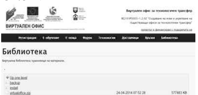
Фиг. 6. Библиотека на ВОТТ.

- Модул „Библиотека“ – представлява виртуално хранилище за мултимедийни материали (ОЕ ресурси, статии, линкове, демонстрации, модули и дори цели курсове за обучение). Библиотеката е разделена на две части: общодостъпна част (достъп до която има всеки потребител на виртуалния офис) и част, в която достъп до материалите имат само членовете на офиса - потребители със съответна оторизация за достъп. Всеки потребител с необходимата оторизация може да допълва библиотеката с интересни материали. (Виж фигура 6.)