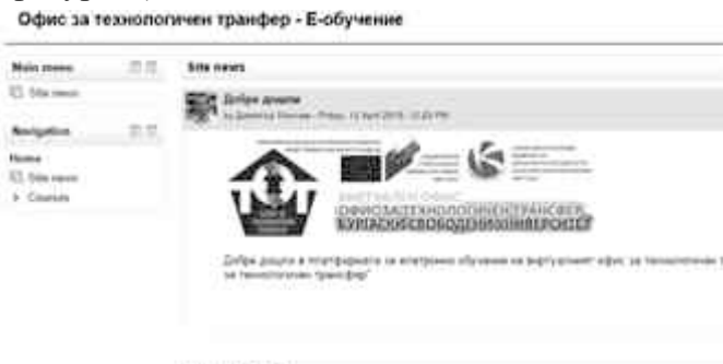
Фиг. 4. Център за е-обучение на ВОТТ.

- Модул „Е-обучение“ – представлява виртуален център за е-обучение, където потребителите на ВОТТ да направят връзка с вече съществуваща виртуална среда за обучение. По този начин те могат да се възползват от всички налични услуги и курсове за обучение, налични в средата, като за това трябва да спазват правилата и нормативната уредба на хост организацията – Бургаския свободен университет. Обучаващите в могат да използват виртуалната среда за обучение и по този начин да организират фирмено обучение на базата на смесени модели на обучение. (Виж фигура 4.)