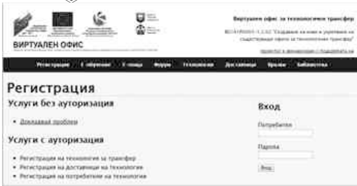
Фиг.3. Модул за регистрация и система за докладване на проблеми.

- Модул „Е-обучение“ – представлява виртуален център за е-обучение, където потребителите на ВОТТ да направят връзка с вече съществуваща виртуална среда за обучение. По този начин те могат да се възползват от всички налични услуги и курсове за обучение, налични в средата, като за това трябва да спазват правилата и нормативната уредба на хост организацията – Бургаския свободен университет. Обучаващите в могат да използват виртуалната среда за обучение и по този начин да организират фирмено обучение на базата на смесени модели на обучение. (Виж фигура 4.)