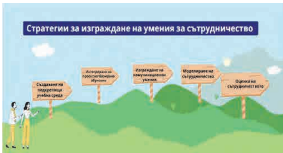
Схема 2. Стратегии, които създават условия за приобщаване и ефективна комуникация между всички участници в образователния процес

Според д-р Джон Хетти, известен специалист по образователни изследвания, „успехът на учениците е тясно свързан с отношението и подкрепата, която получават от учителите си“ (Hattie 2012). Хетти подчертава, че емоционалната и социална подкрепа играят ключова роля за способността на учениците да участват активно и ангажирано в учебния процес. Когато учениците усещат, че техните усилия и идеи се оценяват, те стават по-мотивирани и готови да поемат рискове в ученето.