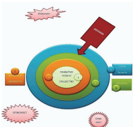
Фиг. 1. Среда за сигурност-общ модел

Първото понятие е „Среда за сигурност”: Разглеждаме два илюстрационни модела – на фиг.1 обща структура, а на фиг. 2 – модел на регионална сигурност [2] .