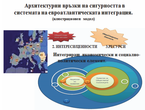
Фиг. 2. Среда за сигурност – регионална

Ядрото на средата за сигурност са хората (фиг.1, елемент1), а в регионалната среда (фиг. 2) – държавите от региона, което недвусмислено показва пряката взаимна зависимост на двете структури. Спояващият/организиращият фактор за обществото са ценностите и формираните от тях интереси (фиг.1, елемент 2), които се разделят на непреходни и преходни (резултат от реализиране на определен етап). Развитието е свързано от една страна с необходимост от ресурси (фиг.1, елемент 3), а от друга с необходимостта за защита на обществото/сила (фиг.1, елемент 4) от възможни опасности и заплахи.