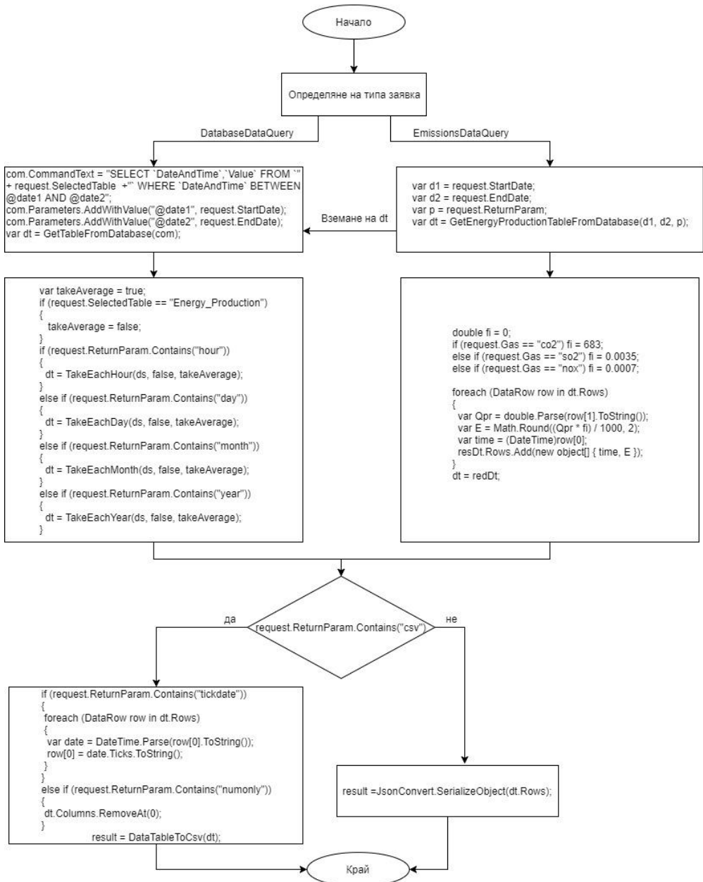
Фиг. 4. Общ алгоритъм за обработка на заявка