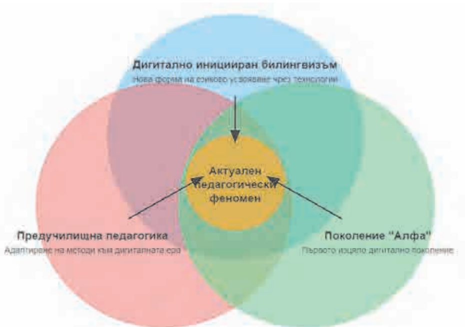
Фигура №1. Възникващ фокус в педагогическата наука

Концептуализацията на дигитално иницирания билингвизъм отразява връзката между научното познание и еволюиращите обществени реалности, адресирайки специфичните нужди на поколение „Алфа“. Подобен кроснаучен подход към проблема не само признава съвременните технологични реалности, но и подчертава отговорността на науката да се адаптира и да отговаря на променящите се социални условия, осигурявайки релевантни знания и решения за предизвикателствата на нашето време.