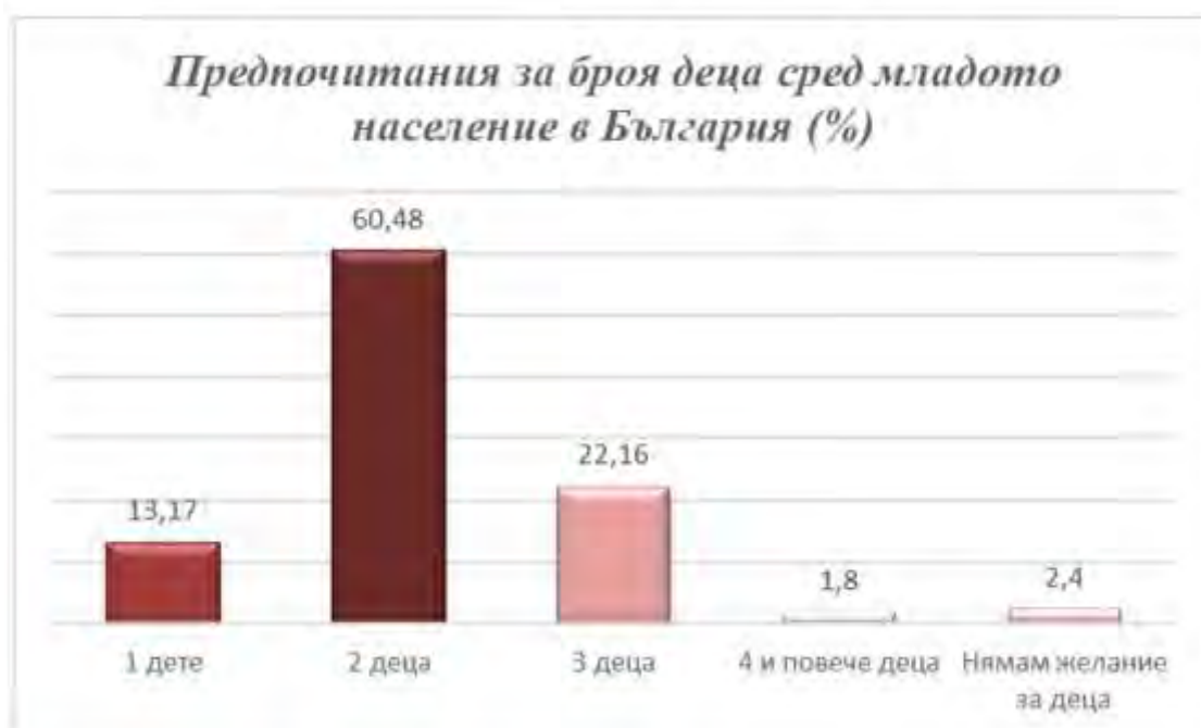
Фигура 4: Предпочитания за броя деца сред младото население в България в проценти

Малкият дял на респондентите, които нямат желание за деца (2,4%), демонстрира наличието на промени в социалните нагласи и възприемането на родителството, като част от младото поколение изглежда предпочита фокуса върху личностното развитие и професионалната реализация. В същото време, едва 1,8% от анкетираните изразяват желание за четири или повече деца, което подчертава рядкостта на големите семейства в съвременния демографски контекст и е индикация за ограничено разпространение на многодетността в България.