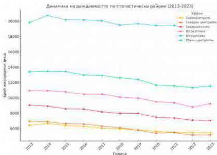
Фигура 1: Динамика на раждаемостта по статистически райони (2013-2023)

Общия брой на ражданията в страната е намалял 9381 за десетгодишния период на изследване. Най-голямо намаление се забелязва в периода 2013-2020 година, след което се наблюдава леко стабилизиране на раждаемостта. Югозападният район е лидер по брой на живородените деца през целия период, което е логично предвид концентрацията на население в София и околните градове. Въпреки това и тук се наблюдава спад, особено в периода 2017-2020 година. Северозападният район показва най-ниски стойности на раждаемост, което отразява неблагоприятната демографска ситуация и обезлюдяването на региона. Югоизточният и Североизточният райони също отбелязват значителен спад в раждаемостта, макар и с по-плавни темпове в сравнение със Северозападния район. Интересно е, че през 2023 година се наблюдава леко нарастване на раждаемостта в някои райони (Югоизточен и Югозападен), което може да е признак на начална стабилизация или дори потенциална промяна в демографската тенденция.