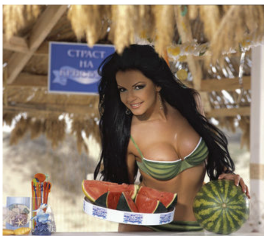
Фиг. 1. Галена в рекламата

Каква е чувствителността на студентите към реклами, в които има подчертано агресивно експлоатиране на женския образ, каквито са рекламите на водка „Флирт” и придобилите огромна популярност реклами на „Мастика Пещера”, озаглавени „Страст на кристали” и „Сезонът на дините” с участието на фолкпевиците Емилия и Галена?