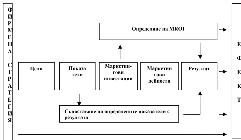
Фигура 2. Определяне ефективността на маркетинговите инвестиции в биопродукти

Терминът възвръщаемост на маркетинговите инвестиции (MROI) е широко застъпен в научната литература. Според Дж. Ленсколд той се използва за да се обозначи концепцията, която далеч надхвърля рамките на получаването на печалба. Под възвръщаемост, твърди Ленсколд, може да се разбира всяка изгода (ефект), която бизнес единицата получава от маркетинговите си инвестиции, в това число и такива показатели като осведоменост за търговската марка и удовлетвореност на потребителите. 25 Въпреки това, тъй като възвръщаемостта обикновено се свързва с финансова изгода, MROI се възприема основно като финансов показател.