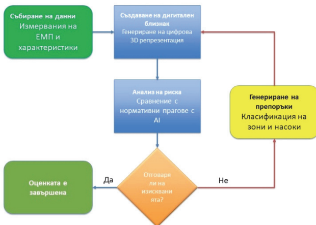
Фиг. 1. Алгоритъм за оценка на риска

Използването на тези съвременни технологии може да съдейства на специалистите от инженерната практика да структурират алгоритми за определяне на стойности за предприемане на действия (Фиг. 1) при оценка на риска от електромагнитни излъчвания чрез [12,13,14,15]: