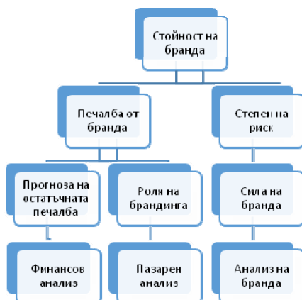
Фигура 2. Методология на Interbrand за определяне на ценността на бранда в схематичен вид

Ценност на бранда ($) = (цена на брандирания продукт – цена на генеричен продукт без бранд) * осъществените съвкупни продажби