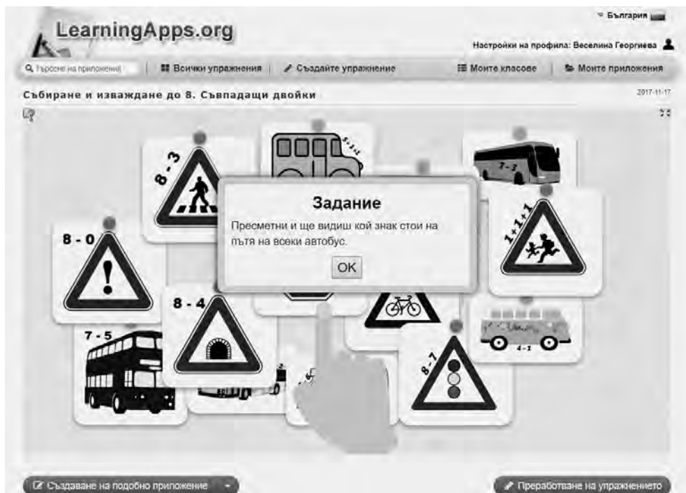
Фиг. 3. Начален екран на игра по математика

На учениците се предлага задача по математика на интерактивната дъска. За да я решат, излизат последователно представители на екипите, извършват математическото действие и свързват получения отговор с определен пътен знак. Обяснява се значението на непознатите и се припомнят познатите пътни знаци. Задачата е създадена на приложението LearningApps ( https://learningapps.org/display?v=pyqattdjt17 ).