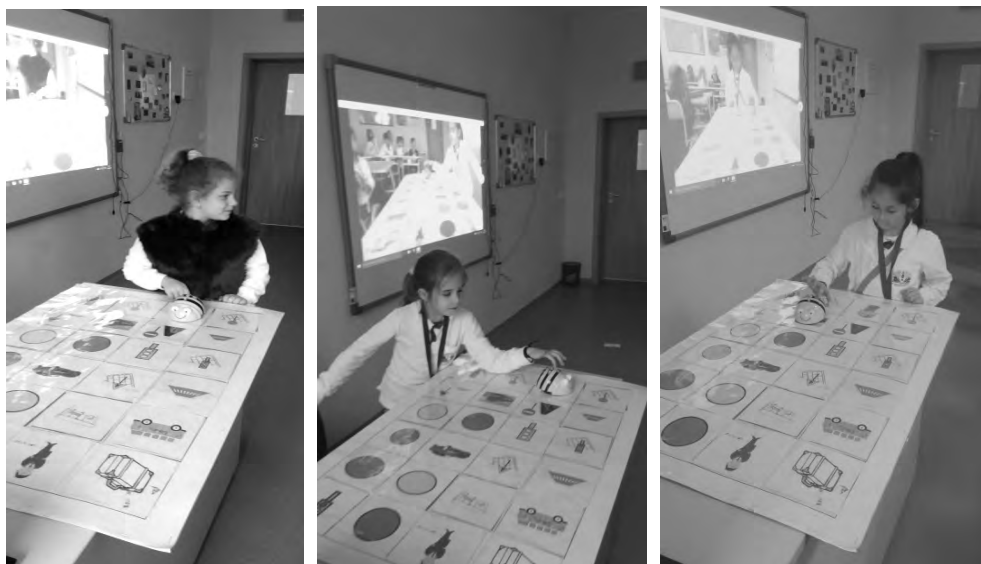
Фот. 1, 2, 3 Работа с интерактивна играчка

Програмирайте пчелата така, че да заведе детето до мъжа, като върви по безопасен маршрут (преди да пристъпят учениците към изпълнението на задачата, с тях се обсъжда какво означава безопасен маршрут – пчелата трябва да не стъпва на уличното платно, а само на тротоара и на пешеходна пътека).