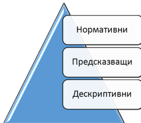
Фиг. 2. Различни форми на модели за анализ и вземане на решения, използвани от маркетинга