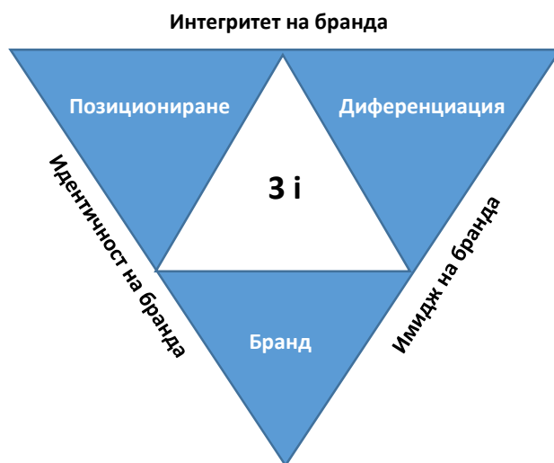
Фигура 7. Моделът 3i - бранд – позициониране – диференциране

Моделът е изцяло в духа на класическата маркетингова концепция и моделът „Маркетинг 3.0“, в който авторите представят идеите си за бъдещето на маркетинга, като проследяват прехода във фокуса на маркетинга от продуктите към клиентите и към човешкия дух.