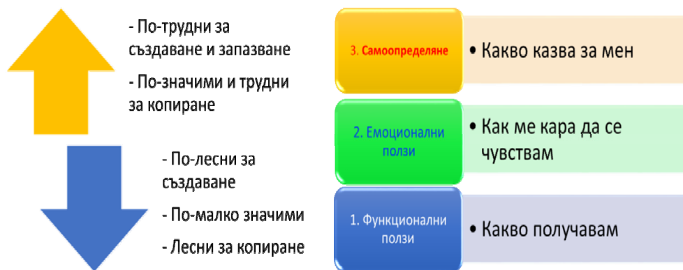
Фигура 4. Модел за създаване на бренд същност (мантра) като част от модела на David Aaker за изграждане на бренд идентичност

В основата на бранда (ядрото) е бренд същността . Тя е сърцето и душата на всеки бренд, които обикновено остават непроменени за дълго време. Бренд същността направлява стратегията и обобщава какво представлява компанията и какво е нейното ключово обещание към клиентите ѝ. Целта на моделът за създаване на бренд същност (мантра) като част от модела на David Aaker за изграждане на бренд идентичност е да се определят функционалните и емоционални ползи от бранда и да бъде определено по какъв начин брендът изразява потребителите си (фиг. 4).