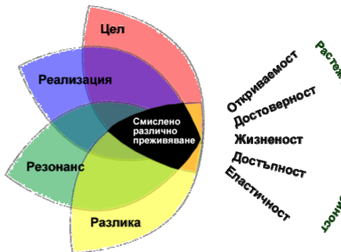
Фигура 6. Графично представяне на модела ValueDrivers Framework на агенция Millward Brown. Моделът е пресъздаден и преведен от автора.

Моделът има три части (фиг. 6) Определяне на смислено различно преживяване (цел, реализация, резонанс, разлика), Увеличаване (откриваемост, достоверност, жизненост, достъпност и еластичност) и Ръст (растеж на финансовата стойност).