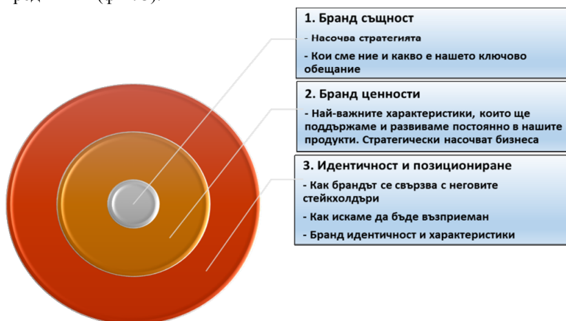
Фигура 3. Моделът на David Aaker за изграждане на бранд идентичност

Моделът на David Aaker за изграждане на идентичност на бранда е един от най-популярните и значими за практиката брандинг модели. 3 David Aaker предлага опростен модел за разбиране и правене на бранда. Моделът за изграждане на идентичност на бранда разглежда всеки бранд като съставен от три слоя като всеки слой надгражда предишния (фиг. 3).