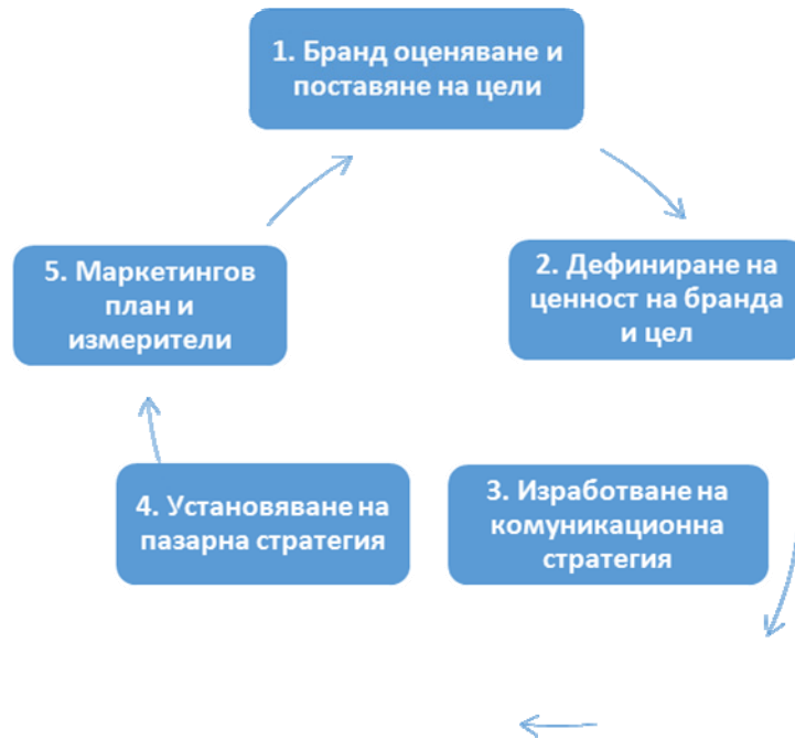
Фигура 8. Графично представяне на модела Star Brands