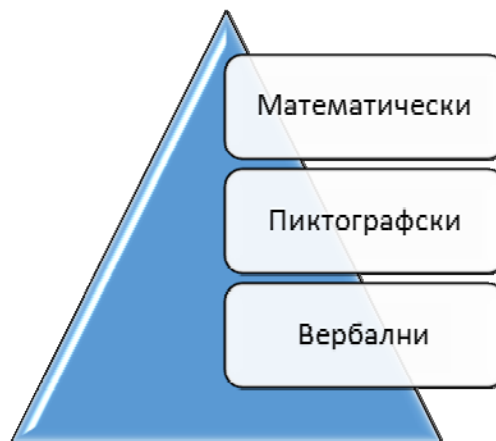
Фиг. 1. Стиллове модели за анализ и вземане на решения, използвани от маркетинга