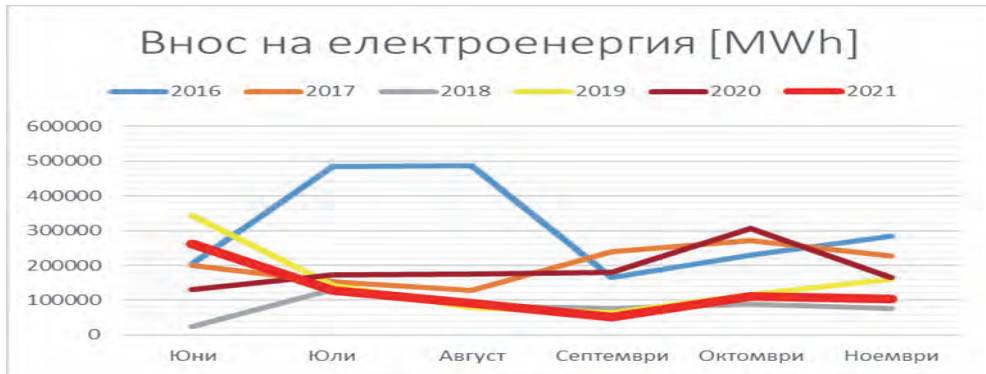
Фиг. 2 Внос на електроенергия.

От направените изследвания се вижда, че основния дял от трансграничния обмен на електроенергия със съседните държави се пада на обмена между България и Румъния. Поради увеличаването на тази тенденция бяха отделени данните за вноса и износа между двете енергийни системи [22].