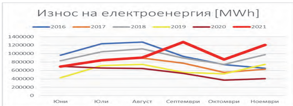
Фиг. 3 Износ на електроенергия.

Данните са представени като абсолютни стойности и като процент от общото производство на електроенергия в България.