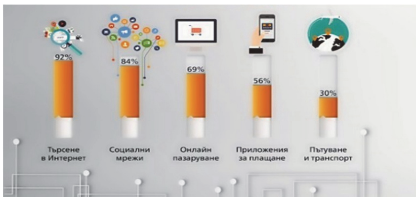
Фиг. 1. Употреба на дигитални услуги

Най-високи очаквания на потребителите имат към внедряването на иновативни услуги в бъдеще. 91% смятат, че все повече сфери от живота следва да бъдат дигитализирани, като най-често посочвани са здравеопазването (53%), общественият транспорт (51%) и образованието (49%).