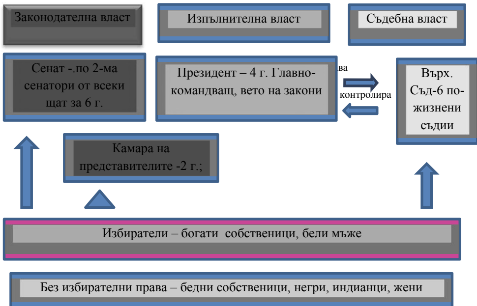
Схема 1. Примерни флаш-карти в лицева страна с понятия

Задача 1. Прочете текста от т.В «Новата държава». Отбележете нови, непознати понятия, напишете ги с цветен маркер по ваш избор от едната страна на картончето, намерете тяхното определение в речника на учебника и накратко, с ключови думи го впишете на обратната страна на съответното картонче. За да изпълните задачата е необходимо да си разпределите съответни роли в групата (виж Схема 1.).