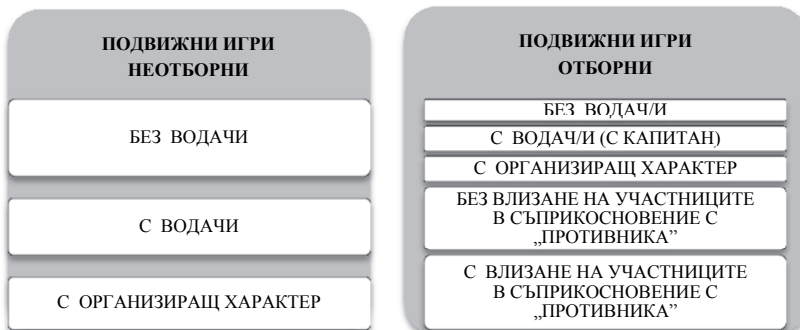
Графика № 1. Подвижни игри според разпределението и ролите на участниците в игровото взаимодействие