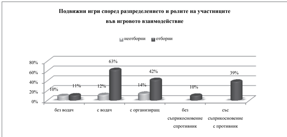
Графика № 2. Подвижни игри, харесвани от децата на 6-7 год.

И трите вида подвижни отборни игри са посочени, че са с много висок интерес за децата, което показва, че трябва да се включат с приоритет в учебното съдържание в обучението на 6-7 годишните деца в детската градина и извън нея. Останалите пет вида подвижни игри имат почти еднакъв избор – неотборни игри с организиращ характер (14%), неотборни игри с водач (12%), неотборни (10%) и отборни (11%) игри без водач , отборни игри без влизане на участниците в съприкосновение с „противника“ (10%).