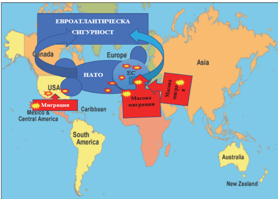
Фиг. 3. Евроатлантическата система под миграционен натиск

Как, къде и кога масовата миграция се превръща във фактор в системата на евроатлантическа интеграция? Нека представим обобщената картина на масовата миграция в евроатлантическата система (фиг. 3). Причините за този процес са многопластови, като основната можем да определим следвайки разглежданите по-горе фактори, а именно-естествения стремеж на хората предприели пътя на мигранта е „да търсят подходящи условия да се развият“. В това няма нищо осъдително или изненадващо доколкото човек в процеса на своята еволюция е мигрирал многократно.