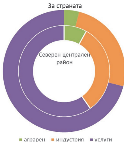
Брутна добавена стойност по икономически сектори, %, 2019 г., Източник: НСИ

Структурата на икономиката се различава значително както спрямо другите райони за планиране, така и в самия Северен централен район. Брутната добавена стойност достига 7.7 млрд. лв., а разпределението е по сектори показва двойно по-широк аграрен сектор (8%, при 4% за страната) и значително по-малък дял на услугите (60%, при 71% за страната) спрямо средните за страната стойности.