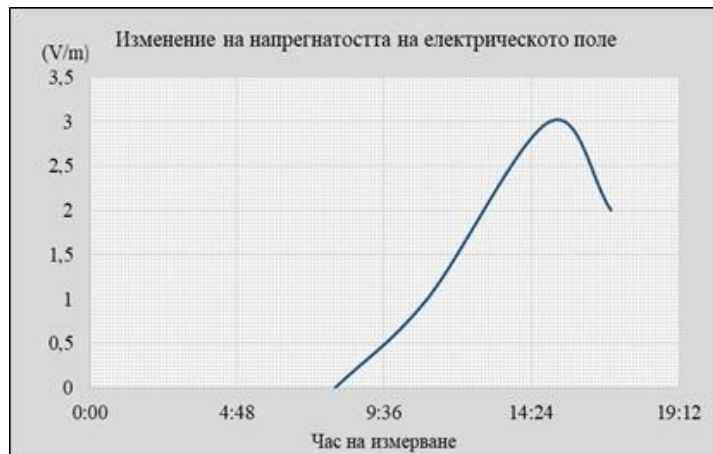
Фиг. 4. Изменение на интензитета на електрическото поле в зависимост от времето на измерване.