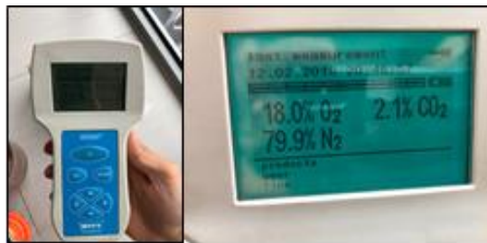
Фиг. 5. Измерване на количеството на отделените от маслото газове с газанализатор OXYBABY 6.0 O2/CO2.

Тази температура съответства най – точно на номиналната работна температура на трансформатора.