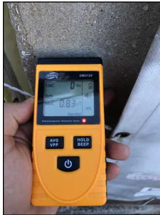
Фиг. 2. Показания на уреда Venetech GM3120 на разстояние 10 cm от трансформатора.

Както се вижда от фигурата, безопасна плътност на магнитния поток се регистрира на разстояние 90 cm от трансформатора.