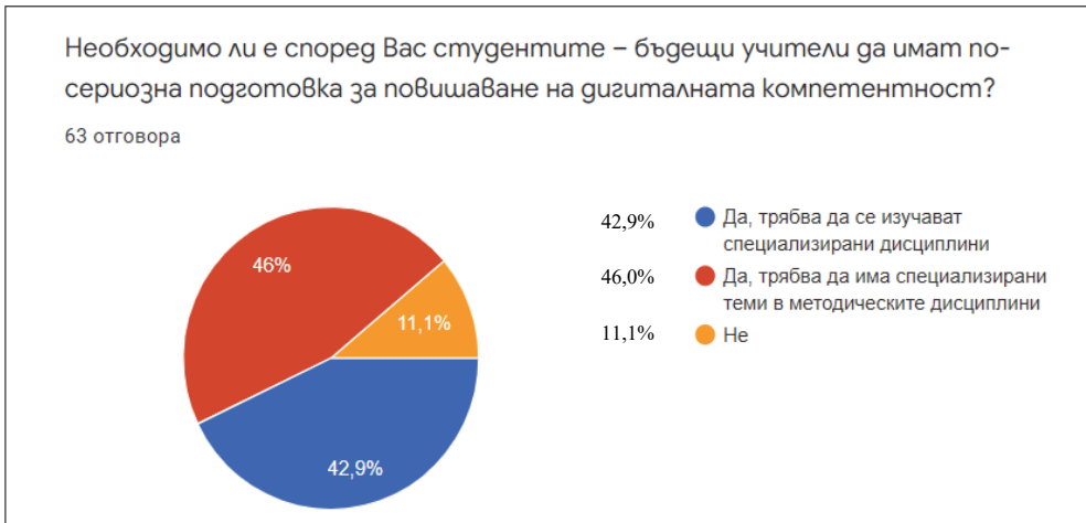
Диаграма 5: Мнение – респонденти, пети въпрос

Изводите , които могат да се направят след анализа на анкетата на базата на мнението на анкетираните студенти, обучаващи се в ОКС „професионален бакалавър“ в Педагогически колеж – Плевен, са следните: