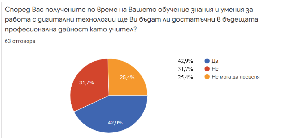
Диаграма 2: Мнение – респонденти, втори въпрос

Третият въпрос е: В дисциплините, които сте изучавали до този момент, представяни ли са ресурси, свързани с дигиталните технологии и педагогическата работа в електронна среда?