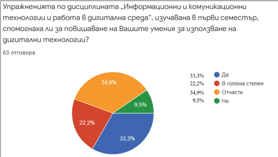
Диаграма 4: Мнение – респонденти, четвърти въпрос

Последният въпрос е: Необходимо ли е според Вас, студентите – бъдещи учители да имат по-сериозна подготовка за повишаване на дигиталната компетентност?