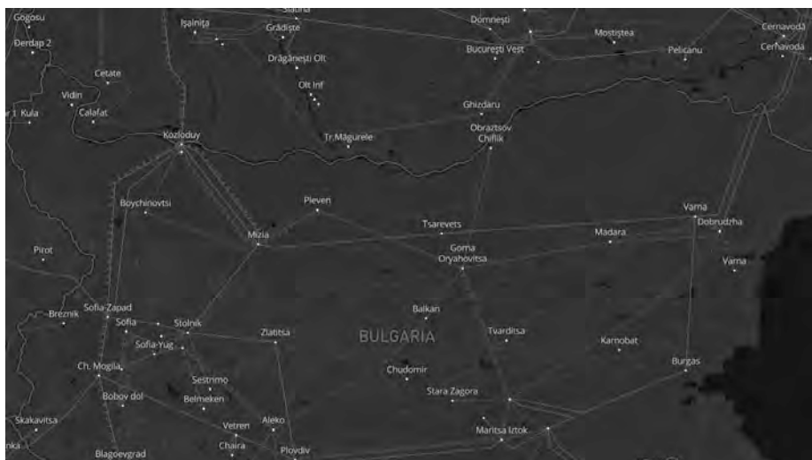
Фиг. 1 – Схема на трансграничната свързаност на България с ЕС.

Схема на инфраструктурата за трансграничната свързаност на България с ЕС, според ENTSO-E е показана на фигура 1. От нея се вижда, че най-добре развита е междусистемната свързаност на България с Румъния. Системният пръстен от преносната инфраструктура на електроенергийната система, изграден от електропроводи с напрежение 400 kV е пряко свързан с преносната система на Румъния. Между преносните системи на България и Румъния са изградени четири електропроводни линии. Две от тях са присъединени към откритата разпределителна уредба (ОРУ 400 kV) на атомна електроцентрала „Козлодуй“ и по една съответно към подстанция „Добруджа“ и подстанция „Варна“. Продължава изграждането и на преносна инфраструктура с останалите съседни държави, даваща възможност за достатъчен преносен капацитет на трансграничен обмен на електроенергия в рамките на ENTSO-E.