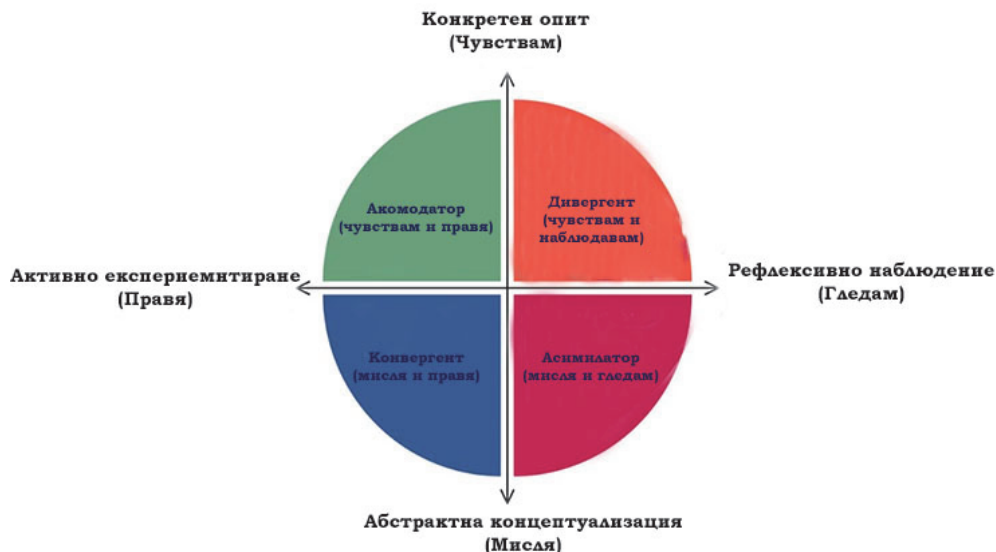
Фигура 1. Модел на Д. Колб за стилове на учене чрез преживяване

Теорията на Колб определя ученето чрез преживяване като процес от четири етапа: