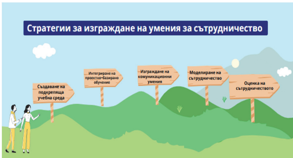
Схема 2. Стратегии, които създават условия за приобщаване и ефективна комуникация между всички участници в образователния процес

Според д-р Джон Хетти, известен специалист по образователни изследвания, „успехът на учениците е тясно свързан с отношението и подкрепата, която получават от учителите си“ (Hattie 2012). Хетти подчертава, че емоционалната и социална подкрепа играят ключова роля за способността на учениците да участват активно и ангажирано в учебния процес. Когато учениците усещат, че техните усилия и идеи се оценяват, те стават по-мотивирани и готови да поемат рискове в ученето.