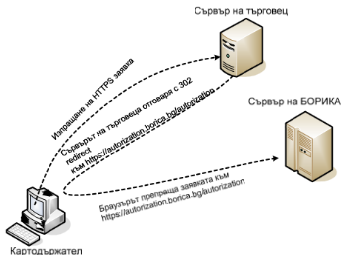
Фиг. 6. Обмен на съобщения

Обменът на съобщения между сайта на търговеца (БСУ) и акцептиращия и платежен сървър на сайта на БОРИКА - БАНКСЕРВИЗ става посредством браузъра на картодръжателя с помощта на метода REDIRECT. На Фиг. 6 е показана схемата на изпращане на съобщение от сървъра на търговеца към сървъра на БОРИКА - БАНКСЕРВИЗ.