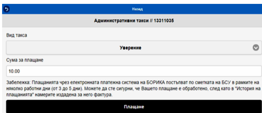
Фиг. 2. Заплащане на административна такса

При избор за заплащане на административни такси, платформата за електронни услуги на БСУ предлага избор, както на вида такса, така и на дисциплината, ако таксата е за ликвидация. На фиг. 2 е показан екран за заплащане на административна такса.