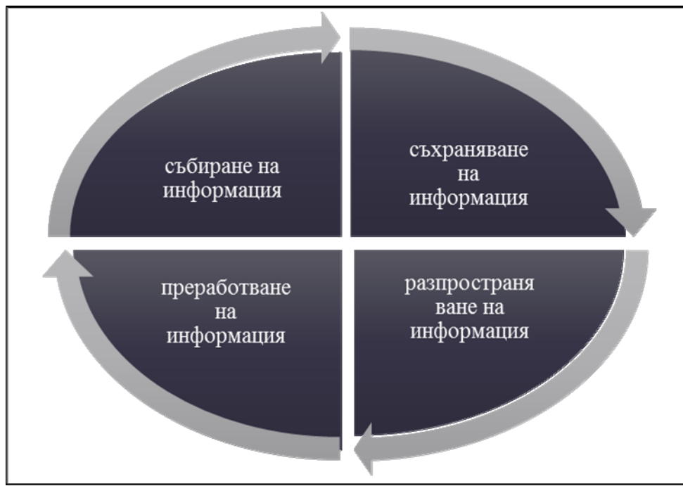
Фиг. №.1 Елементи на информационния процес

Широкоспектърният обхват на информацията позволява да се заключи, че информационните процеси са в основата на всички дейности и процеси. Всеки информационен процес може да бъде представен с помощта на четири основни информационни компонента, както е показано на фиг.№1: