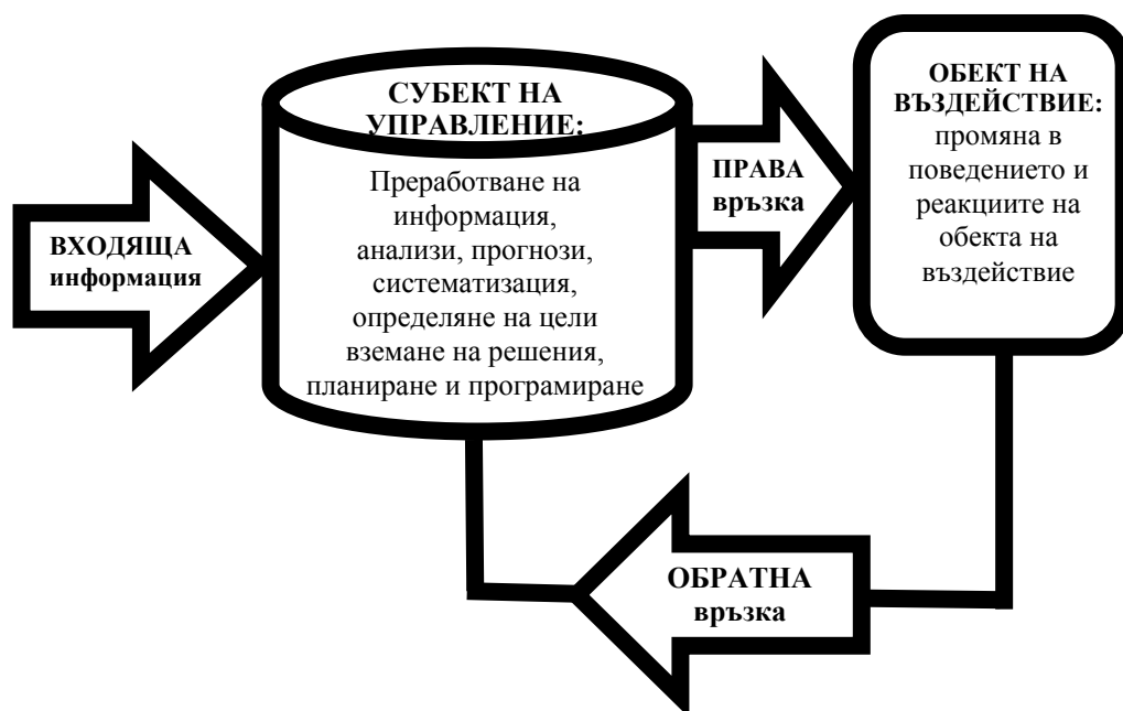
Фиг. №2. Управлението като информационен процес

Управлението, като информационен процес обхваща всички процеси и дейности до постигането на желаното състояние, като се позовава на всички възможни и достъпни ресурси за генериране, обработка и използване на всякакви информационни източници за реализиране на желаното състояние – цел. Същността на управлението, като информационен процес е представена графично на фиг. №2: