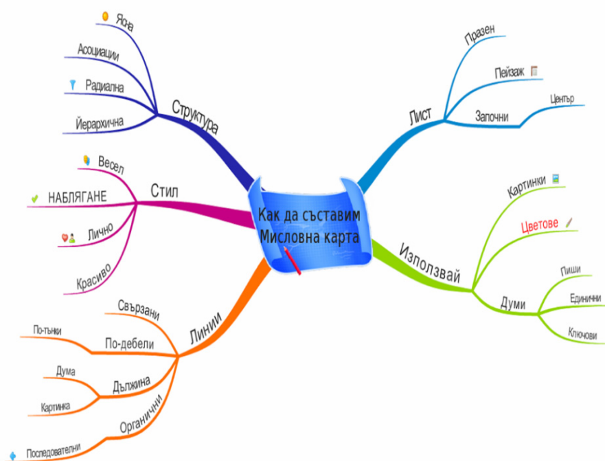
Фигура 1. Основни правила за създаване на мисловна карта

когато се потрудите да ги извлечете и трансформирате в ключов образ“ [2, с.145]. Ключовите образи са важна част от изработването на мисловната карта. Поради тази причина с помощта на фантазията мисловната карта може да се обогати с картинки, символи, образи (в т.ч. и с изрезки от вестници и списания). По този начин рисунката ... се превръщат във визуален образ, който представя не само написаното основно понятие, но и в събирателен образ на цял главен клон от мисловната карта.