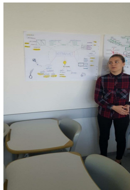
Снимки 2 и 3. Презентиране на теми от учебните курсове по „Пресжурналистика“ и „Общуване с медиите“